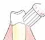
Zet de tandenborstel onder een hoek van 45 graden op het tandvlees