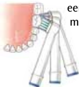
Volg de vorm van de tanden en kiezen

Houd een vaste poetsvolgorde aan. Begin steeds voorzichtig aan de buitenkant in de bovenkaak en poets die helemaal. Schuif de borstel steeds één tand of kies op. Poets dan de hele binnenkant van de bovenkaak. Doe dat ook weer tand voor tand. Let erop dat u de borstelkop diep tussen de kiezen en tong plaatst. Anders raken de borstelharen de kiezen niet goed en wordt het randje van het tandvlees niet schoon. Poets ook de achterkant van de laatste kies zorgvuldig. Poets vervolgens bovenop de kiezen (de kauwvlakken). Poets ook hier weer kies voor kies. Poets daarna op dezelfde manier de buitenkant van de onderkaak, gevolgd door de binnenkant en ten slotte weer bovenop.