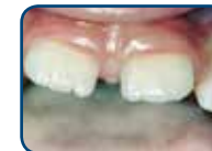
Tanden van het blijvend gebit hebben een kartelrand